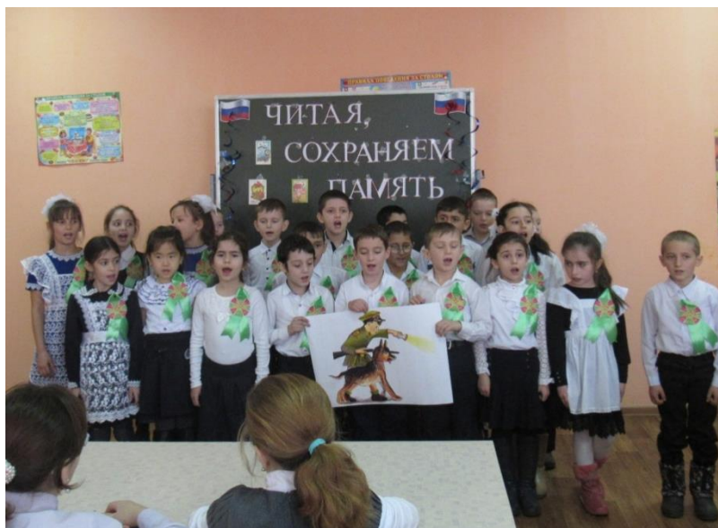
Конкурс рисунков «Наша армия родная на защите всей страны»