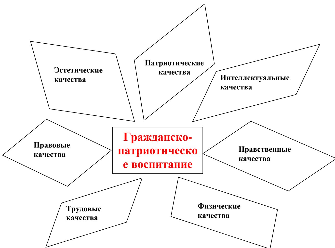
Рис. Гражданско-патриотическое воспитание

Таким образом, гражданско-патриотическое воспитание – это целенаправленный процесс формирования гражданственности и патриотичности как качеств, представляющих совокупность социально значимых гражданских свойств личности, обусловленных особенностями, динамикой и уровнем развития общества, состоянием его экономической, духовной, социально-политической и других сфер жизни.